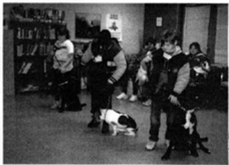
Virginia Beach SPCA's Pets and Pals program teaches children to love their dogs as well as how to treat animals and people with kindness, respect, and compassion.

Reaching At-Risk Youth Indeed, one of the single most important steps your agency can take is to get parents, teachers, and others in the community to understand that animal cruelty cannot be summarily dismissed as typical childhood exploration. "We go into schools and give workshops to teachers on this topic, and on violence prevention generally—but specifically focused on these kinds of connections."