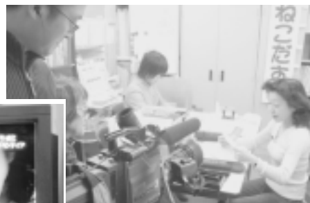
インタビュー取材中(上の写真)