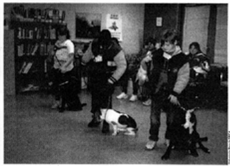
Virginia Beach SPCA's Pets and Pals program teaches children to love their dogs as well as how to treat animals and people with kindness, respect, and compassion.