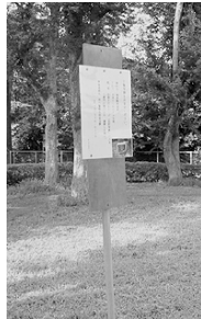
ポスター看板-1 (平成17年6月)

目撃情報をお寄せください。 事件名 愛護動物遺棄 日にち 平成十七年六月十日頃 概要 仔猫3匹をケージ(右記写真)に入れ、公園内に運び込み、遺棄した疑い。 情報連絡先 ○警察署生活安全課 (0●●)●●0・0110